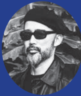
沖野修也 音楽プロデューサー/ 作曲家/DJ