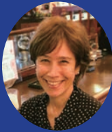
アイリーン・美緒子・スミス 環境ジャーナリスト